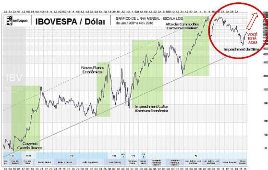
SÉRIE HISTÓRICA DO ÍNDICE BOVESPA (BOLSA DE VALORES DE SÃO PAULO) EM DÓLAR

O início de 2008 foi um período de muita euforia na bolsa de valores porque a economia se encontrava em uma fase de forte crescimento. A Bolsa e a economia têm ciclos de alta e baixa. Com um pouco de esforço fiz boas “apostas” e ganhei altos retornos com algumas ações de empresas imobiliárias. Foi nessa época também que acabei iniciando o curso de Economia.