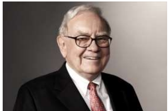
WARREN BUFFETT, FUNDADOR DA BERKSHIRE HATHAWAY

Mais tarde meu fascínio pela bolsa me levou a trabalhar no mercado financeiro! A oportunidade de trabalhar em alguns dos melhores fundos de investimento, iguais aqueles de consagrados investidores como Warren Buffett, Charlie Munger, Jim Rogers, Peter Schiff, me abriram um mundo de informações e conteúdo.