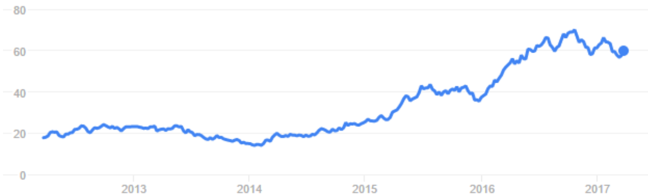
HISTÓRICO PREÇOS DA REDE DE FARMÁCEAS RAIÁ DROGASIL (RADL3)

São milhares de negócios que estão sendo feitos a cada minuto com ações de diversas companhias e a diferentes preços, o que faz os preços variarem ao longo do tempo.